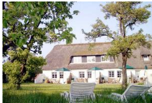
Genießen Sie den wunderschönen Garten.

Entfernungen, zirka: zum Bäcker 300m, zum Einkaufsladen 300m, zum Flugplatz 5,0km, zum Golfplatz 5,0km, zum Hafen 3,0km, zum Meer 3,0km, zum Badestrand 3,0km, zum Ortszentrum 50m