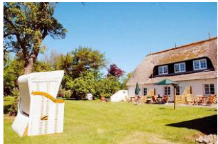
Lust auf Föhr

Herzlich Willkommen in unserem renovierten Hotel Rackmers-Hof, mit gepflegter Wellnesslandschaft (zwei Saunen, Whirlpool), liegt in Oevenum, einem der ältesten Orte der Insel Föhr, eingebettet in einem herrlichen alten Obstgarten. Oevenum bietet mit seinem dörflich, friesischem Charakter neben einem Kaufmann, eine Bäckerei, gemütliche Restaurants, kleine inseltypische Geschäfte, einen Teeladen und vieles mehr. Die trubelige Promenade in Wyk erreichen Sie ebenso wie den Strand in nur zehn Fahraradminuten. Der Rackmers-Hof wurde als Kapitänshaus erstmals 1845 erwähnt. Im Jahr 2007 / 2008 wurde der Hof von Grund auf renoviert und durch zwei Reetdachhäuser erweitert. Bei den Umbauarbeiten wurde viel Wert auf den typischen Friesenhauscharakter gelegt. Wir freuen uns Sie verwöhnen zu dürfen!